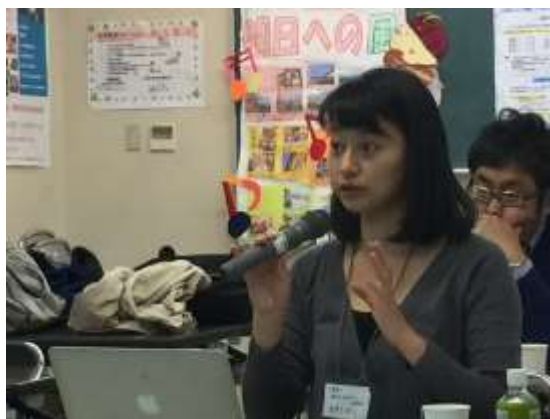
12月5日 東広島ワークショップ・見学会