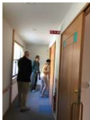
10月25日コミュニティハウス法隆寺見学会