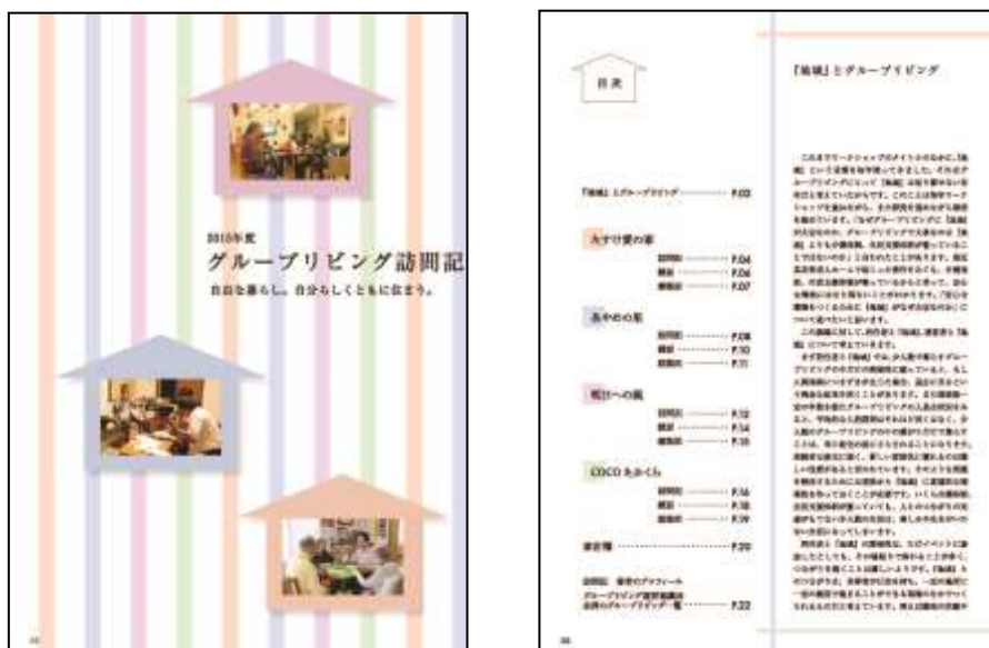
訪問記 表紙・目次

http://www.glnet-groupliving.org/files/uploads/2015houmon.pdf