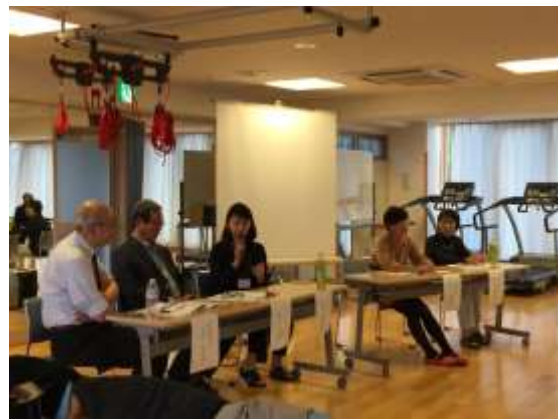
10月24日奈良ワークショップ・見学会