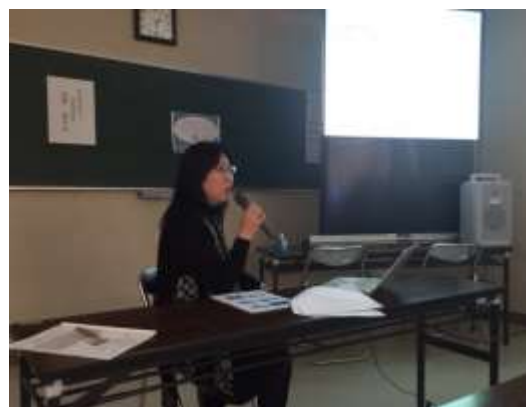
12月5日 東広島ワークショップ・見学会