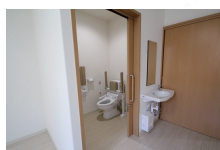
居室内トイレ・洗面